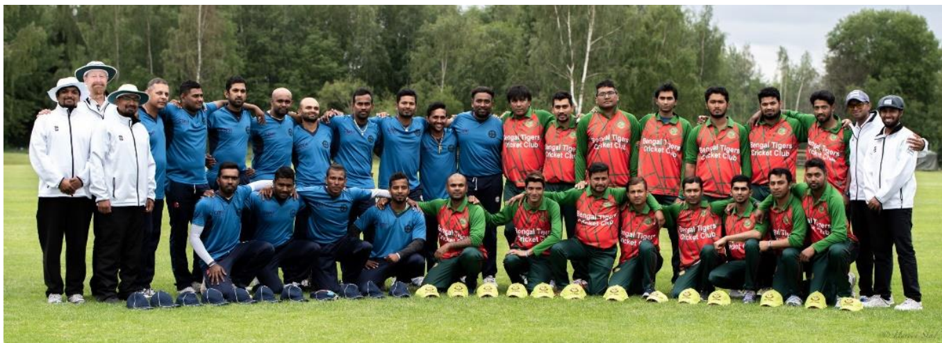
Kuva alla: SM-viikon 2018 finalistit, Vantaan Tikkurilassa

Aiempien vuosien SM-viikoista saatujen hyvin myönteisten kokemusten perusteella Krikettiliitto on jo päättänyt lähteä mukaan heinäkuussa 2019 järjestettävään SM-viikkoon. Mukaan tulee jälleen edelliseen SM-viikkoon verrattuna suurempi määrä joukkueita tavoittelemaan lajin todellisen pikapelin suomenmestaruutta. Ennen finaaliweekkia pelataan karsintasarja/-turnaus, jonka perusteella valikoidaan varsinaisiin SM-viikon otteluihin mukaan pääsevät joukkueet. T10-pelimuoto tulee olemaan yksi liiton työkaluja uusien pelaajien mukaan saamiseksi.