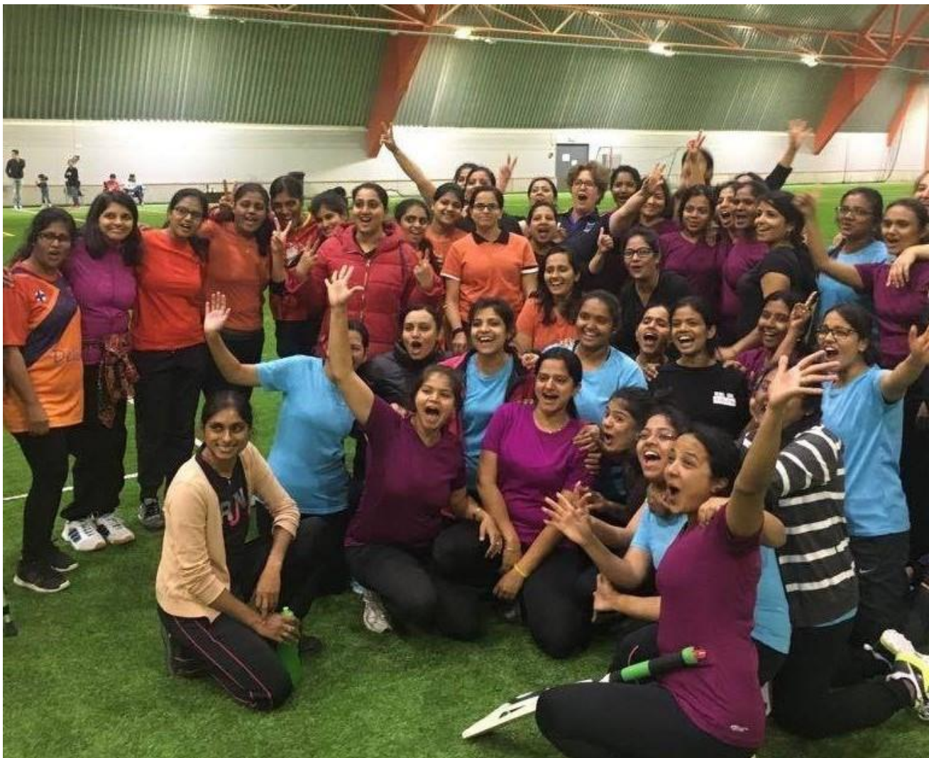
Turnaus takana ja mieli on hyvä