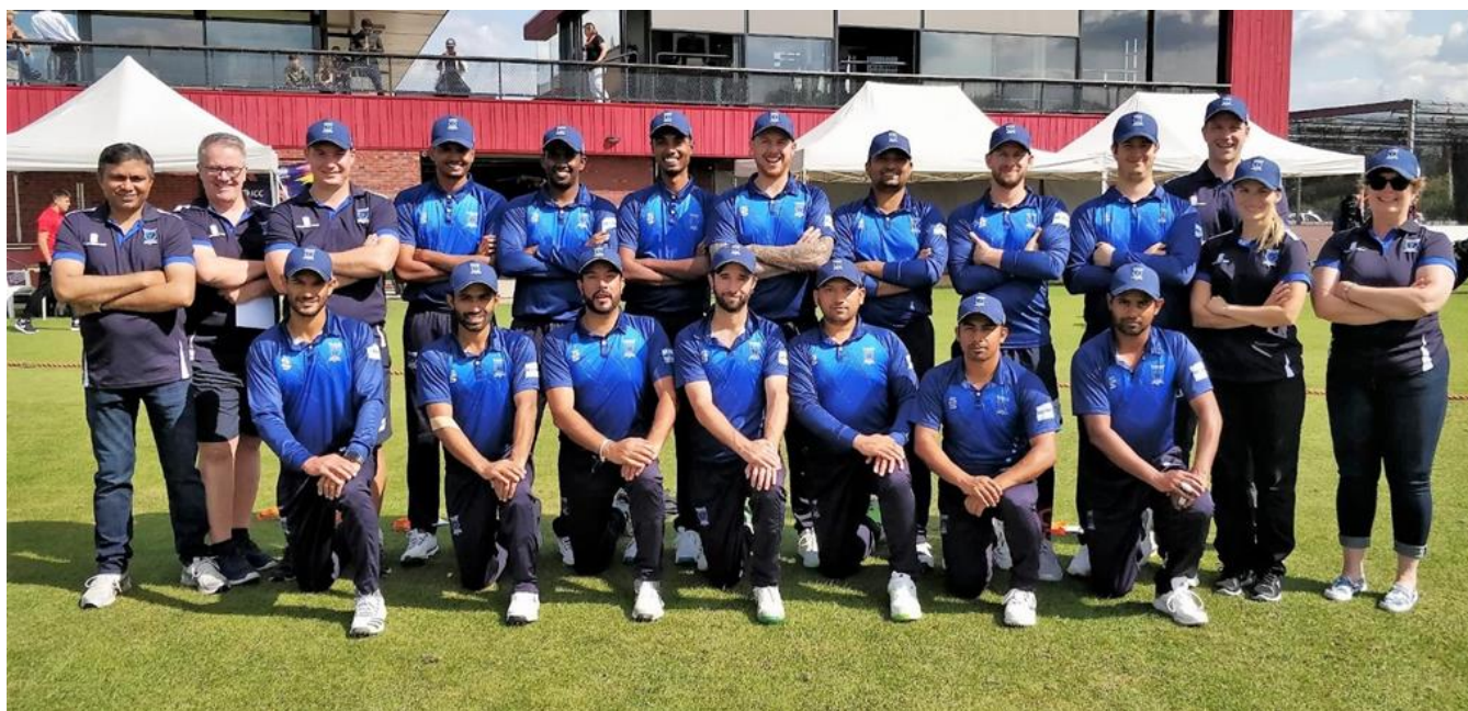
Suomen maajoukkue – ”Finnish Bears” 2018 MM-karsinnoissa Alankomaissa

Miesten maajoukkue osallistuu T20-pelimuodon maailmanmestaruuskarsintoihin, joista seuraava järjestetään keväällä 2020. Maajoukkueen valmistautumista karsintaan tuetaan järjestämällä monikansallinen harjoitusturnaus kesällä 2019. Lisäksi järjestetään maaotteluviikonloppu Tanskaa vastaan.